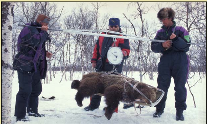
Björnstammen i Sverige anses idag vara livskraftig. Här ses en sövd björn vägas av det skandinaviska björnprojektet.

Antal djur är alltså ett enkelt, tydligt och utvärderingsbart kriterium på en arts status, men livskraft är så mycket mer. Vi har ändå valt att utgå från antal individer som grundkriterium för WWFs förslag till principer för rovdjursförvaltning, genom att sammanväga de demografiska, genetiska, juridiska och praktiska villkor som vi bedömer rimliga att ta hänsyn till. Konkret kan man uttrycka det så att vi tycker att det är ett bättre mått på "livskraftig" att 500 djur kan leva på ett naturligt biologiskt och säkert sätt i vår natur än 1 000 djur som lever under konstant stress och hot.