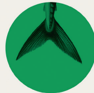
Illustration: Foto: Scandinavisk Fiskebyrå/WWF (fisk), DDB Stockholm (redfish), Brian J. Sherry / National Geographic Stock (WWF (jama lakslax), Produktion Odette & CO 2016 / 116246