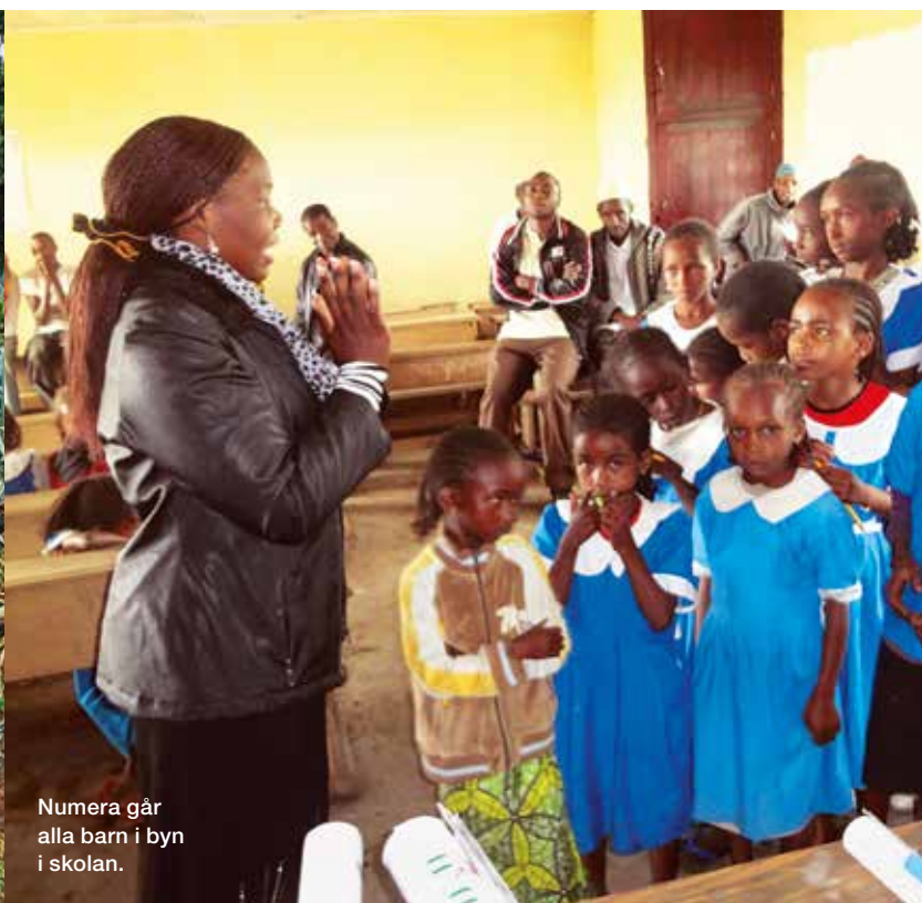
Numera går alla barn i byn i skolan.