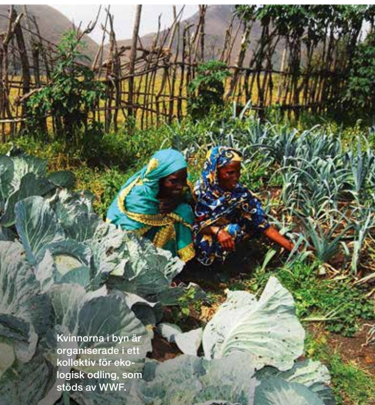
Kvinnorna i byn är organiserade i ett kollektiv för ekologisk odling, som stöds av WWF.